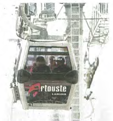
Les salariés de la station d'Artouste craignent pour leur emploi.