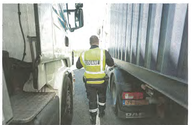
Dans les Pyrénées-Atlantiques, sept infractions ont été relevées sur 26 poids lourds contrôlés.

Ces contrôles ont porté en priorité sur le respect du Code de la route et de la réglementation européenne en matière de transport. Elles ont donné lieu à sept infractions relatives au temps de conduite avec une seule immobilisation du véhicule.